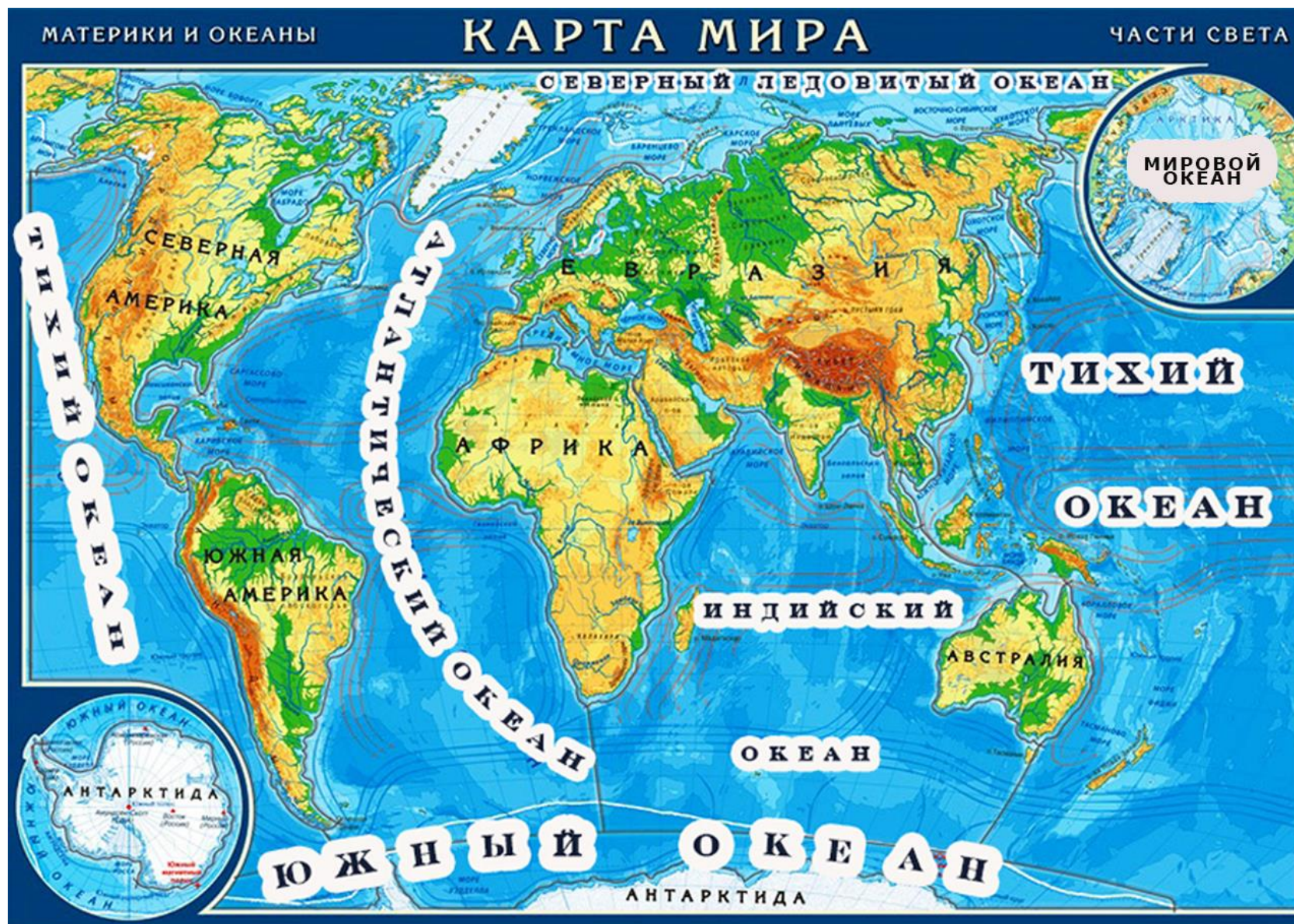
Приложение 2 Физическая карта мира

VI Областной чемпионат «Школьные навыки» для обучающихся 2-х, 3-х, 4х, 5-х, 6-х классов организаций, осуществляющих образовательную деятельность по образовательным программам начального общего, основного общего образования Школьный этап