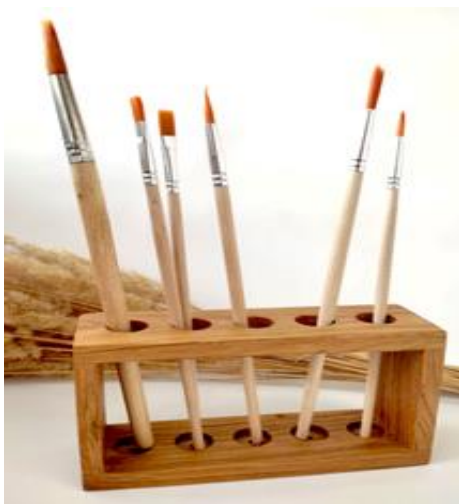
Рисунок 1. «Подставка для кисточек»

Габаритные размеры изделия: 10x40x90 (мм). Предельные отклонения размеров \pm 1 мм.