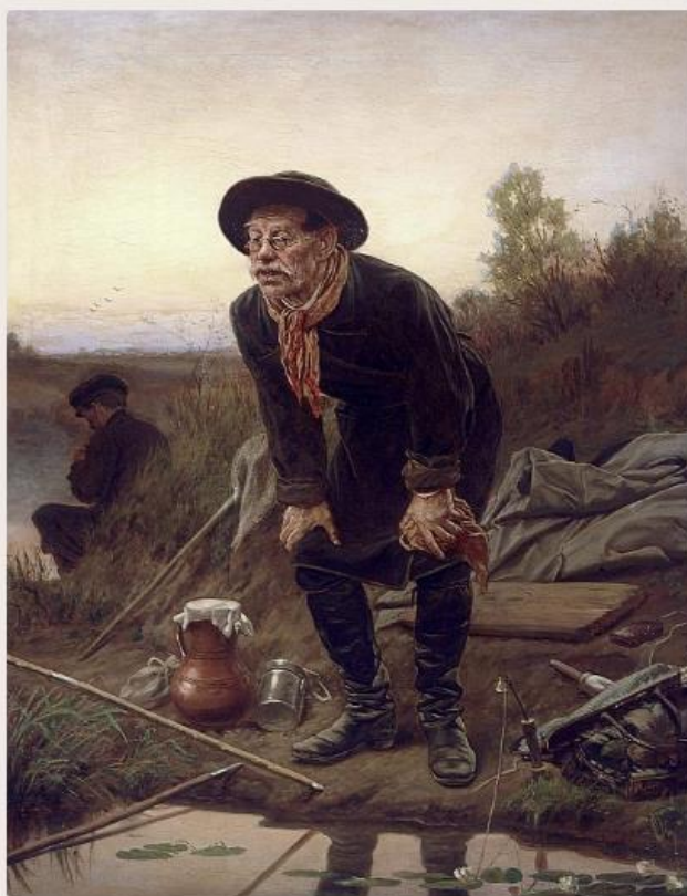
Василий Григорьевич Перов – Рыболов 1871. 91×72