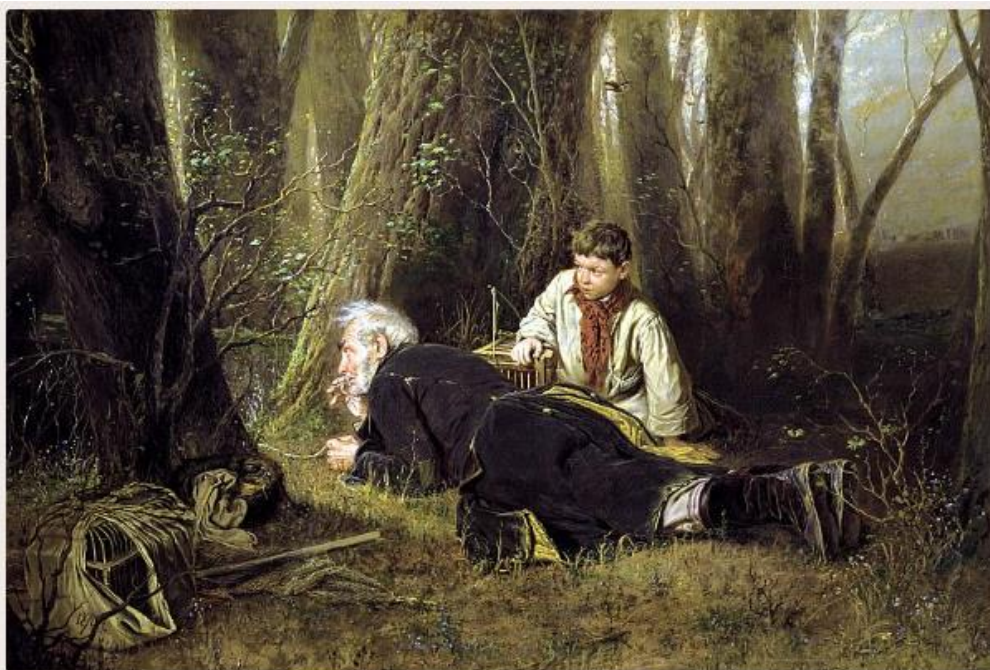
ПЕРОВ Василий – Птицелов