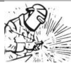
Таблица для ответа