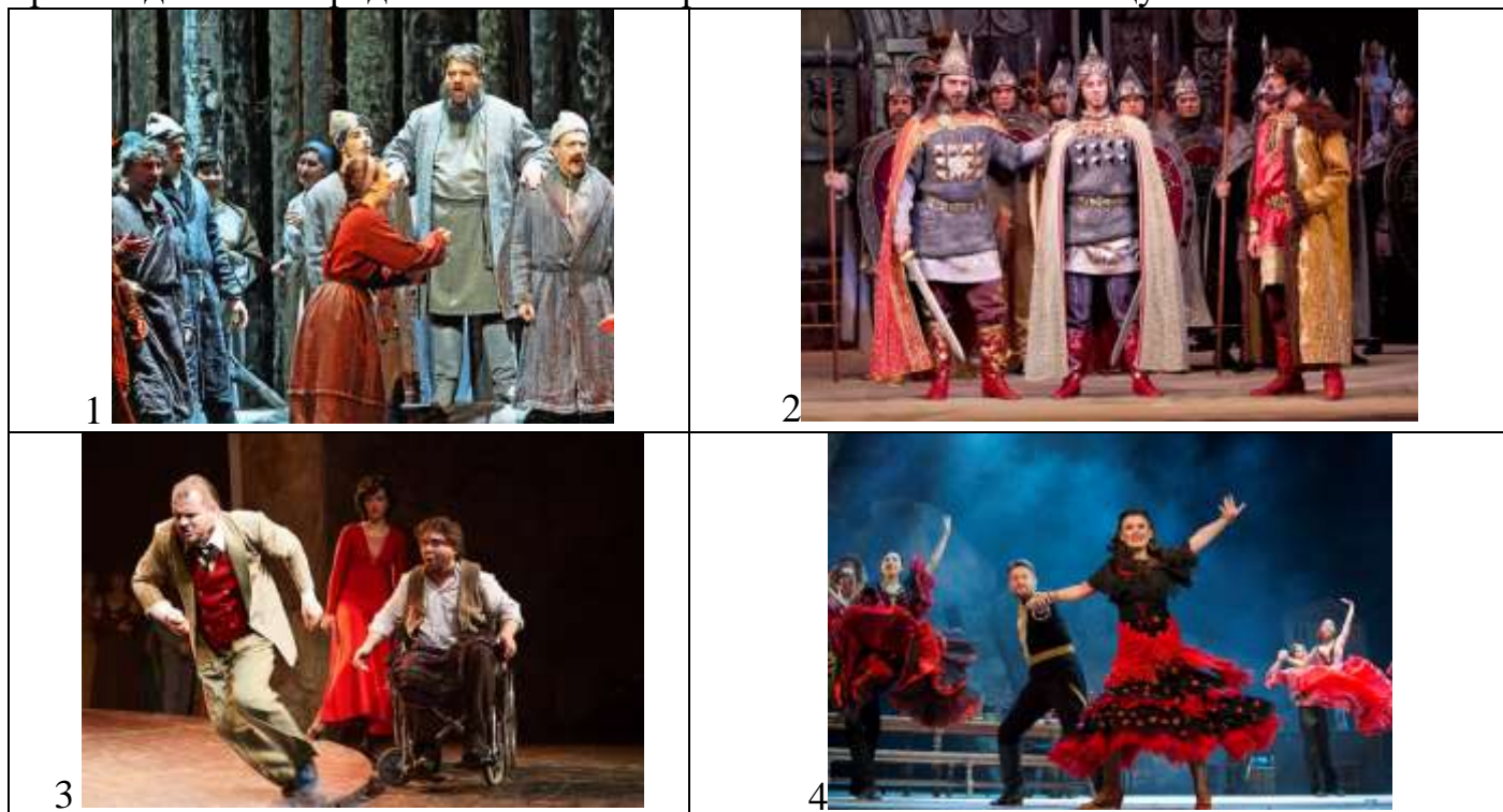
Таблица для ответа

Внимательно рассмотри данные иллюстрации. Укажи названия произведений, композитора, год или век создания. Назови имена главных героев. Назови жанр произведений и определение этого жанра. Ответ запиши в таблицу.