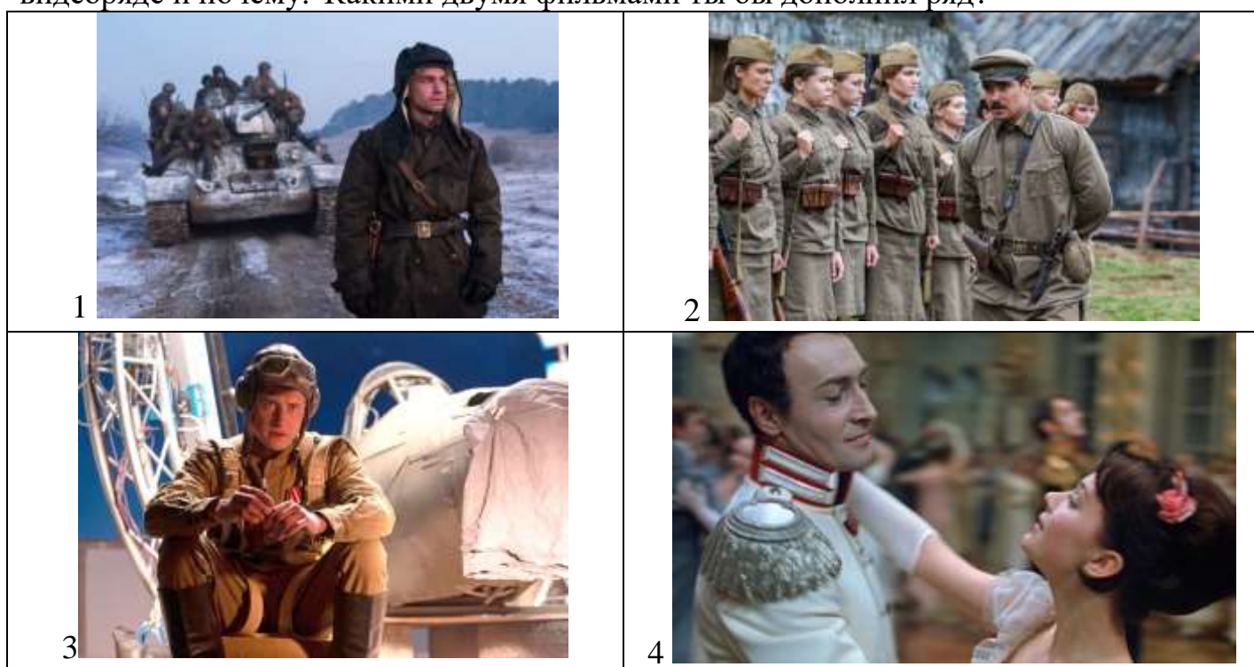
Таблица для ответа

Даны кадры из художественных фильмов. Укажи названия кинофильмов, год, век выхода на экран. Назови по одному имени главных героев и актёров-исполнителей главных ролей в этих кинофильмах. Ответ запиши в таблицу. Сделай вывод, что объединяет эти кинофильмы и какой фильм является лишним в предложенном видеоряде и почему. Какими двумя фильмами ты бы дополнил ряд?