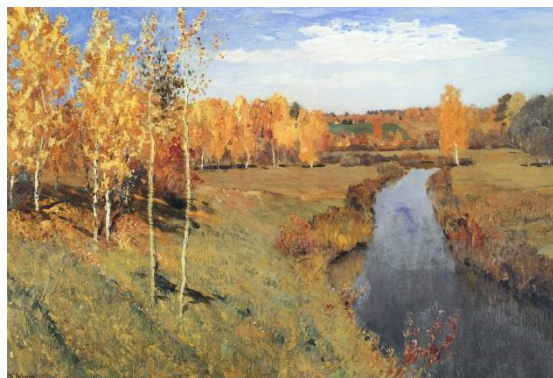
ЛЕВИТАН Исаак Ильич. Золотая осень (1895 г.)