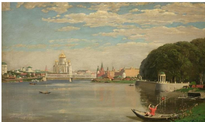
ВАСНЕЦОВ Аполлинарий Михайлович. Вид на Крымский мост, Кремль и Храм Христа Спасителя со стороны Нескучного сада (1878 г.)