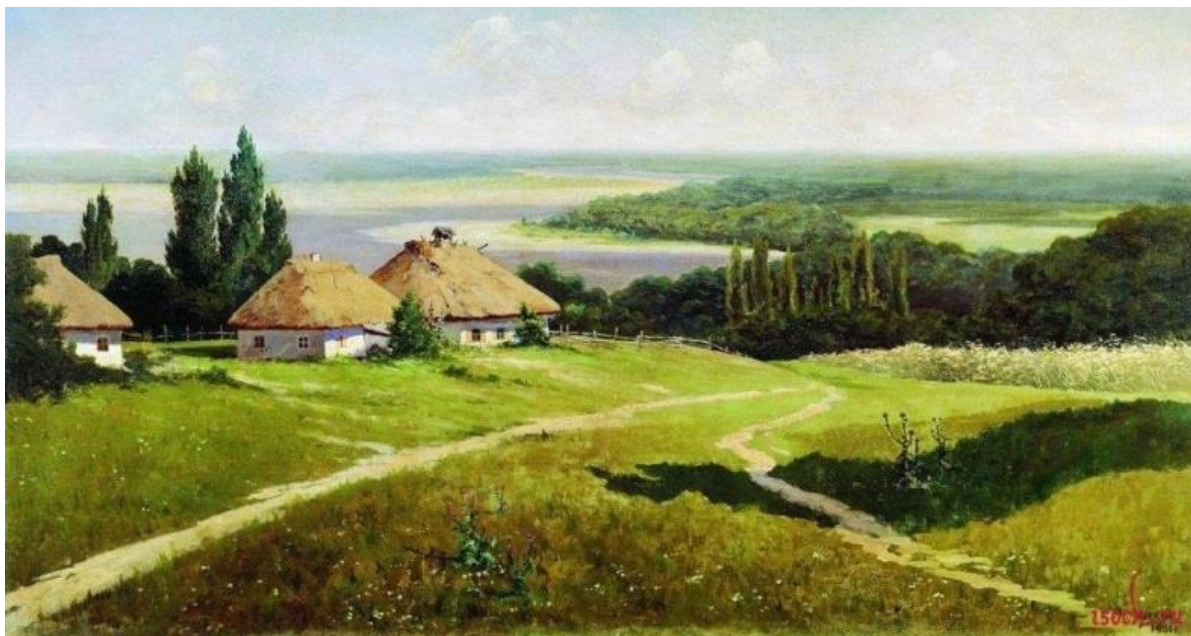
МАКОВСКИЙ Владимир Егорович. Украинский пейзаж с хатами (1901 г.

2. Опишите замысел картины, изображающей украинский пейзаж. Для этого опишите сюжет картины: описание переднего и заднего планов, деталей, роль и используемые художником средства выражения. Дайте общий анализ и описание того, что хотел сказать автор.