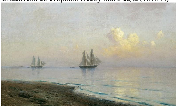
ЛАГОРИО Лев Феликсович. Морской пейзаж с парусниками (1891 г.)