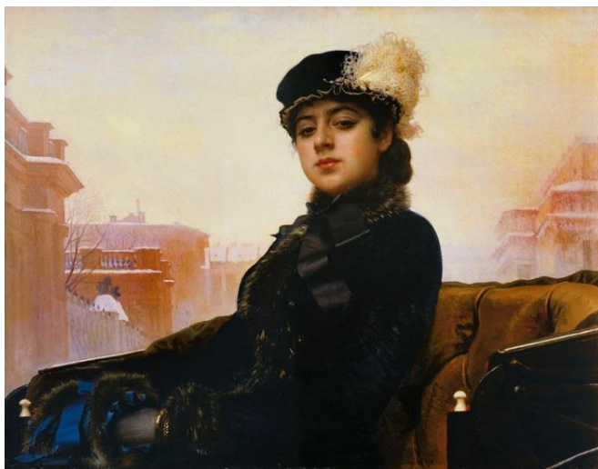
Неизвестная. 1883 г. 75,5 x 99 см. Холст, масло.