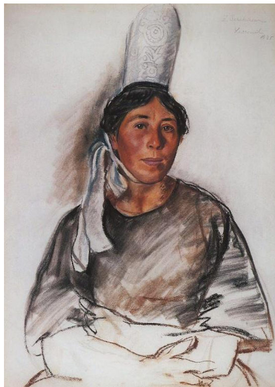
Молодая бретонка. 1934 г. 63 x 48 см. Бумага, пастель.

Омский областной музей изобразительных искусств имени М.А. Врубеля