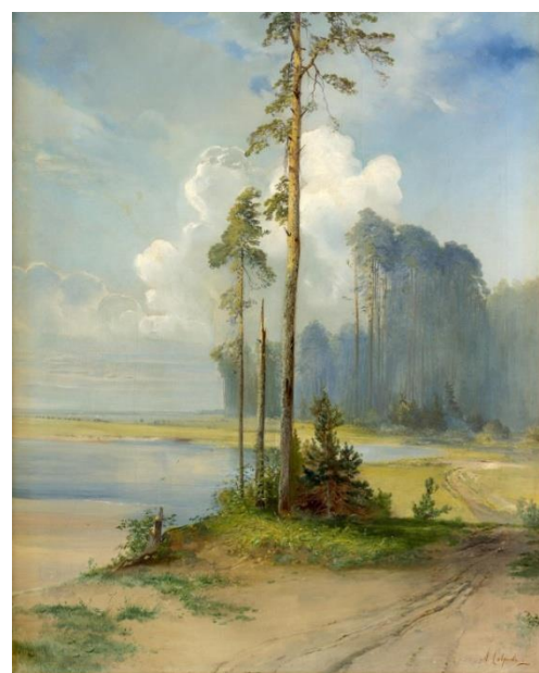
САВРАСОВ Алексей Кондратьевич. Летний пейзаж. Сосны (1880-е гг.)