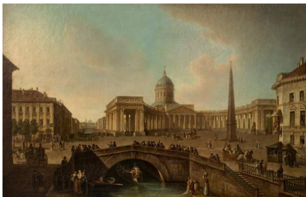
АЛЕКСЕЕВ Федор Яковлевич. Вид Казанского собора в Петербурге (не ранее 1810 г.)