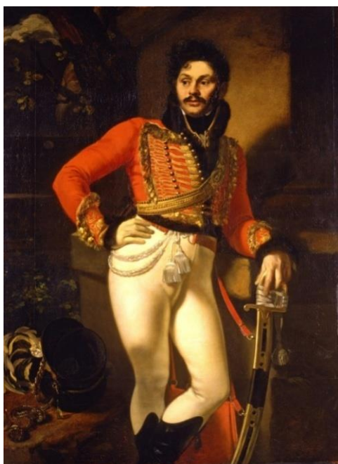
Кипренский Орест Адамович. Портрет Евграфа Владимировича

И след простыл!.. То невидимкой он, то рядом, То, вынырнув опять, следом Идет за шумными французскими полками И ловит их, как рыб, — без невода, руками... Его постель — земля, а лес дремучий — дом; И часто он с толпой башир и с казаками, И с кучей мужиков и конных русских баб, В мужицком армяке, хотя душой не раб, Как вихорь, как пожар — на пушки, на обозы, И в ночь, как домовой, тревожит вражий стан! Но милым он дарит в своих куплетах розы <.....>, это ты — поэт и партизан!