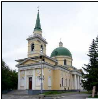
3. Никольский казачий собор