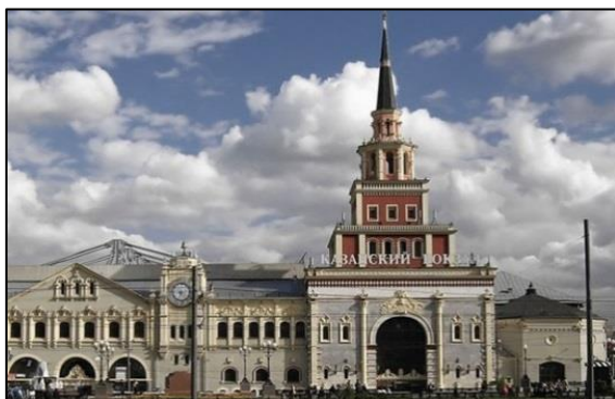
1. Здание Казанского вокзала железной дороги