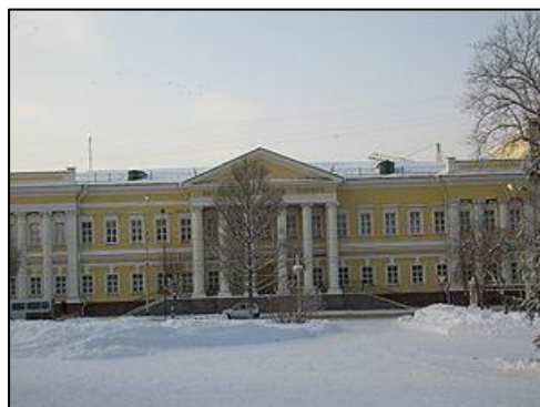
2. Здание Войскового казачьего училища, высшего общевоинского командного училища, кадетского военного корпуса