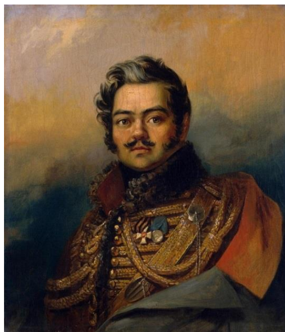
Джордж Доу. Портрет Дениса Васильевича