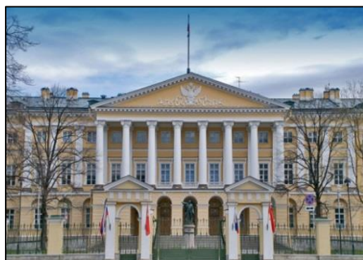
6. Смольный институт благородных девиц