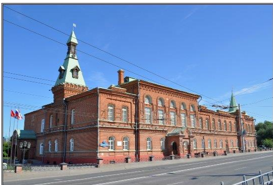
5. Здание Городской Думы и управы